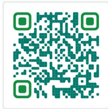
Figure 1: QR Code sistem eKerosakan

1. Laporkan di sistem http://ekerosakan.pkb.edu.my